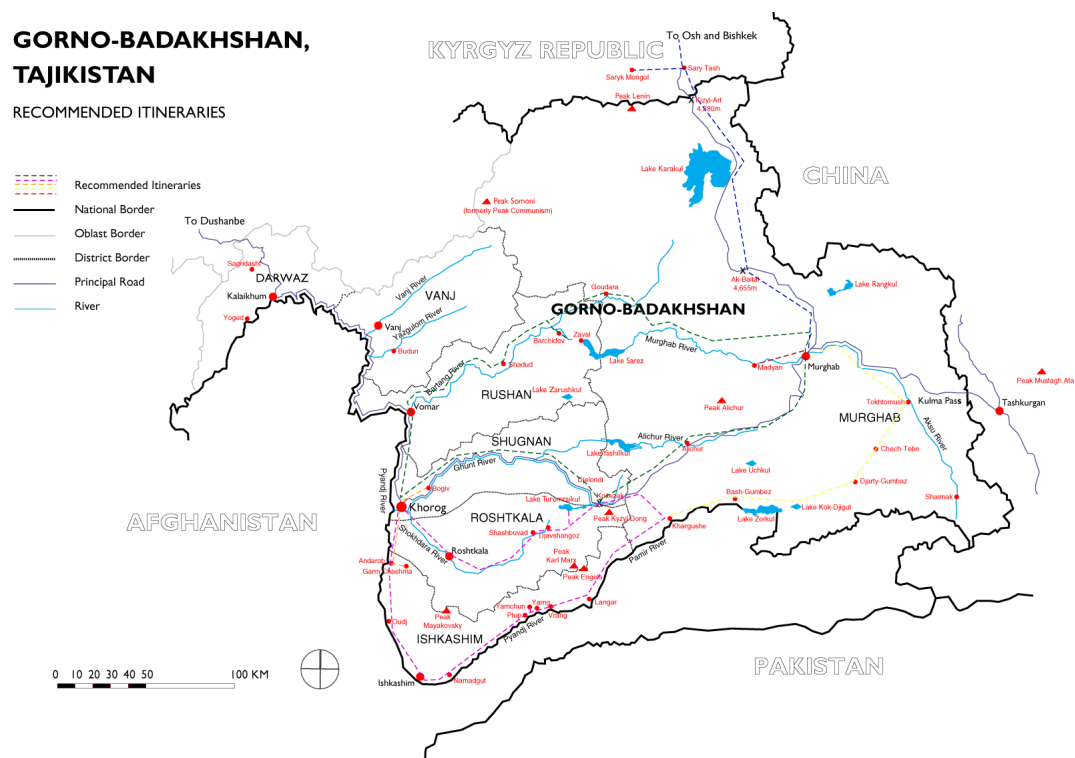
Obrázek 2. Mapa Autonomní oblasti Horského Badachšanu (GBAO).